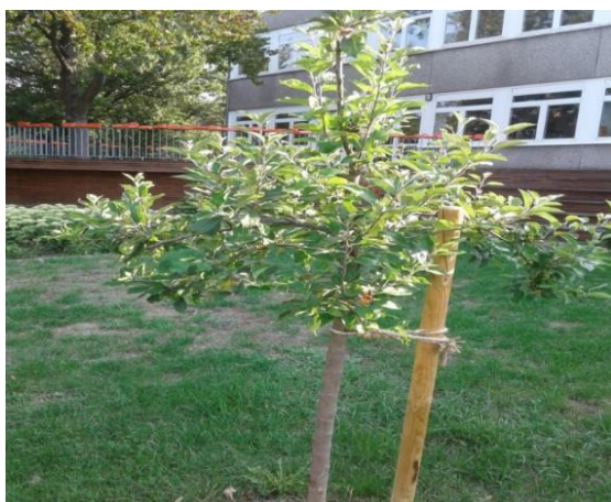
Obstbäume an der Alfred-Herrhausen-Schule