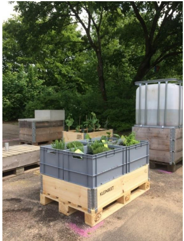
Ausstattung für das Urban Gardening

Von den Preisgeldern wurden beispielsweise Obstbäume, Materialien für die Nachhaltigkeits-AG und Zubehör für den Tierschutzhof des Tierschutzvereins Düsseldorf angeschafft.